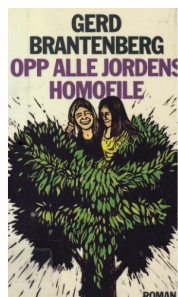
Opp alle jordens homofile Gerd Brantenberg 1973

Odd Lyng skammer seg over å være skapt «som mand» med «en kvindes hjerte» og drømmen om kjærlighet kunne aldri oppfylles for ham.