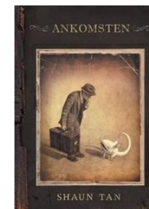
Ankomsten Shaun Tan 2006