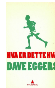
Hva er dette hva : Va- lentino Achak Dengs selvbiografi Dave Eggers 2006

«Jeg skal på en reise», sa Némirovsky til sine to små døtre da fransk politi arresterte henne i 1942. Bare fem uker senere tok livet hennes brått slutt i Auschwitz. Hun etterlot seg to døtre og en koffert full av skriverier. I mer enn 60 år lå manuskriptet gjemt i en koffert, før datteren ga den ut. Boken ble straks en litterær sensasjon.