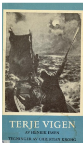
Terje Vigen Henrik Ibsen 1861

«Du seilte i mak på din store korvett, jeg rodde min ringe båt, jeg trellet for mine til døden trett, du tok deres brød, og det falt deg så lett å håne min bitre gråt.» Fra Terje Vigen Henrik Ibsen.