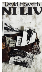
Ni liv - historien om Jan Baalsrud David Howarth 1955